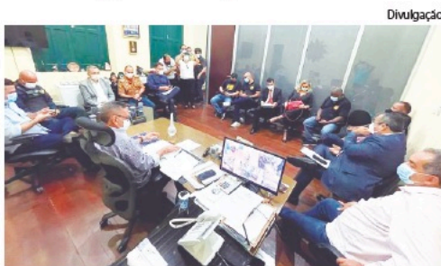
Dirigentes de associações policiais durante reunião com secretários de estado na sede da SSP

Dentro da proposta de revisão salarial do governo, anunciada anteriormente e que deve ser mandada nos próximos dias para a Assembleia Legislativa (Alese), as categorias de segurança pública